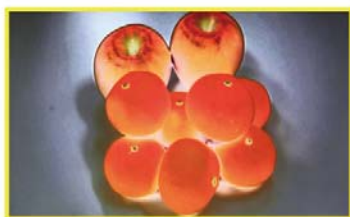
【カラーピーキング機能有効時】ピントが合っている状態