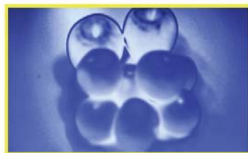
【モノクロピーキング機能有効時】ピントが合っていない状態