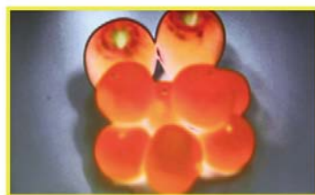
【カラーピーキング機能有効時】ピントが合っていない状態